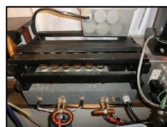
6080 3パラ OTL アンプ