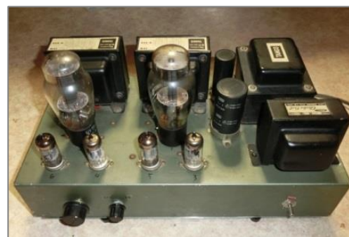
神戸時代に作った VT-52 アンプ

神戸に行ってから、トランジスタアンプを作った2度ばかりで、傷心を癒やすべく、当時話題になっていた古典球なるものを購入すべく、古典球の