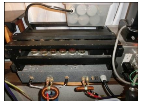
6080 3パラ OTL アンプ 神戸時代の2パラから3パラに改良 平滑コンデンサーはフィルムコン使用 コストダウンの為、木製シャーシ使用

生演奏との出会い前の独身時代、会社の同僚がポータブルのCDプレーヤーを持ち込んできたのがCDとの初遭遇です。当時、ラジオ技術誌の紙上で、デジタルマスターと各種カートリッジの試聴試験が行われ、ダイナベクター社の