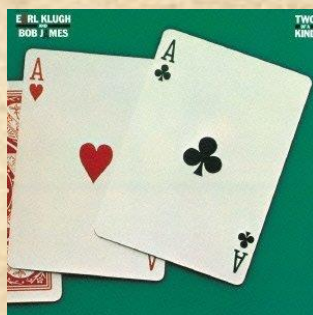
<2> Two of A Kind